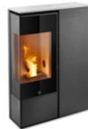
I-DEA 2 ANGOLO

dimensions produit (LxHxP mm) 846x1155x276