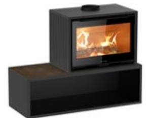
QUADRO+ CERAMIC avec BANC PREMIUM

dimensions produit (LxHxP mm) QUADRO+ CERAMIC 856x625x508 | BANC PREMIUM 1400x450x560