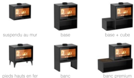
suspendu au mur

Le poêle à bois QUADRO+ est disponible en deux tailles 68 et 80 cm, et en de nombreuses combinaisons. QUADRO+ Steel peut être installé: comme poêle au sol avec pieds réglables, en version suspendue au mur, avec banc élégant - dans le modèle basic ou premium.