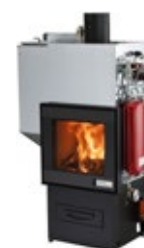
FOGHET EVO IDRO