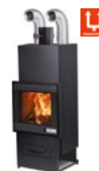
FOGHET EVO ARIA