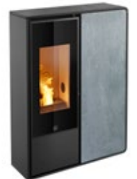
I-DEA 2 FRONTALE